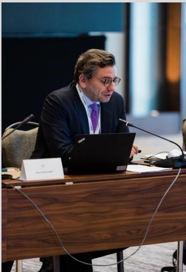
Wojciech Postulski, EU DG JUST

Истовремено присуството на високите претставници на DG JUSTICE EU, European institute for public administration (EIPA) Luxemburg, European Judicial Network (EJTN), Council of Europe, École nationale de la magistrature (ENM) France, AIRE Center London и нивните излагања го потврдија големиот углед што го има Академијата на меѓународно поле.