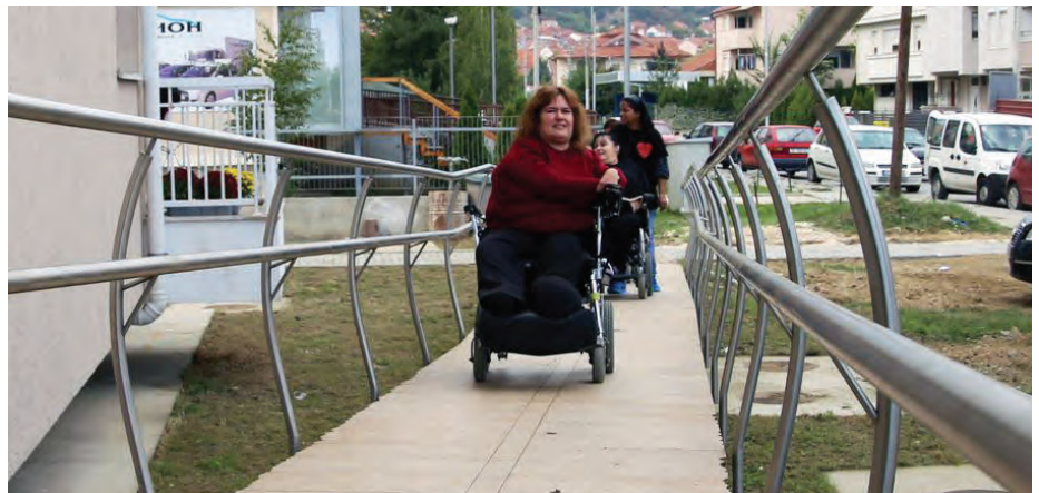
Фотографија од активностите во заедничката програма „Работејќи оддолу-нагоре – градење на локален модел за деинституционализација“

Развојот за инклузија на попреченоста фати замав со ратификацијата на Конвенцијата за правата на лицата со попреченост (КПЛП) во 2011 год. кога дојде до промена од медицинскиот и добротворниот пристап за попреченоста кон пристап заснован на човековите права. Во земјата беа преземени важни чекори за да се обезбеди дека лицата со попреченост ги уживаат истите стандарди на квалитет, права, и достоинство како и секој друг член на општеството. Бројот на закони, политики и програми за попреченоста се во пораст. Попреченоста е вклучена како посебен основ за дискриминација, заедно со останатите форми на повеќекратна и интерсекциска дискриминација. Институционалната поставеност и капацитети се зајакнати, и воспоставени се национални механизми за имплементација на КПЛП и мониторинг. Еднаквоста и инклузијата на сите се поставени високо на агендата на новата влада.