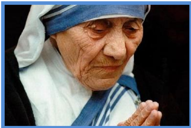
- Мајка Тереза

НЕ МОЖЕМЕ да ПРАВИМЕ ГОРЕШНИ НЕШТА, НО МАНИТЕ МОЖЕ ДА ГИ ПРАВИМЕ со ГОЛЕМА ЛУБОВ!